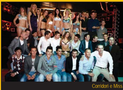
Corridori e Miss

concorso con oltre 60 iscritte e abbiamo già alcune tappe programmate in diverse regioni italiane, meglio di così non poteva andare".